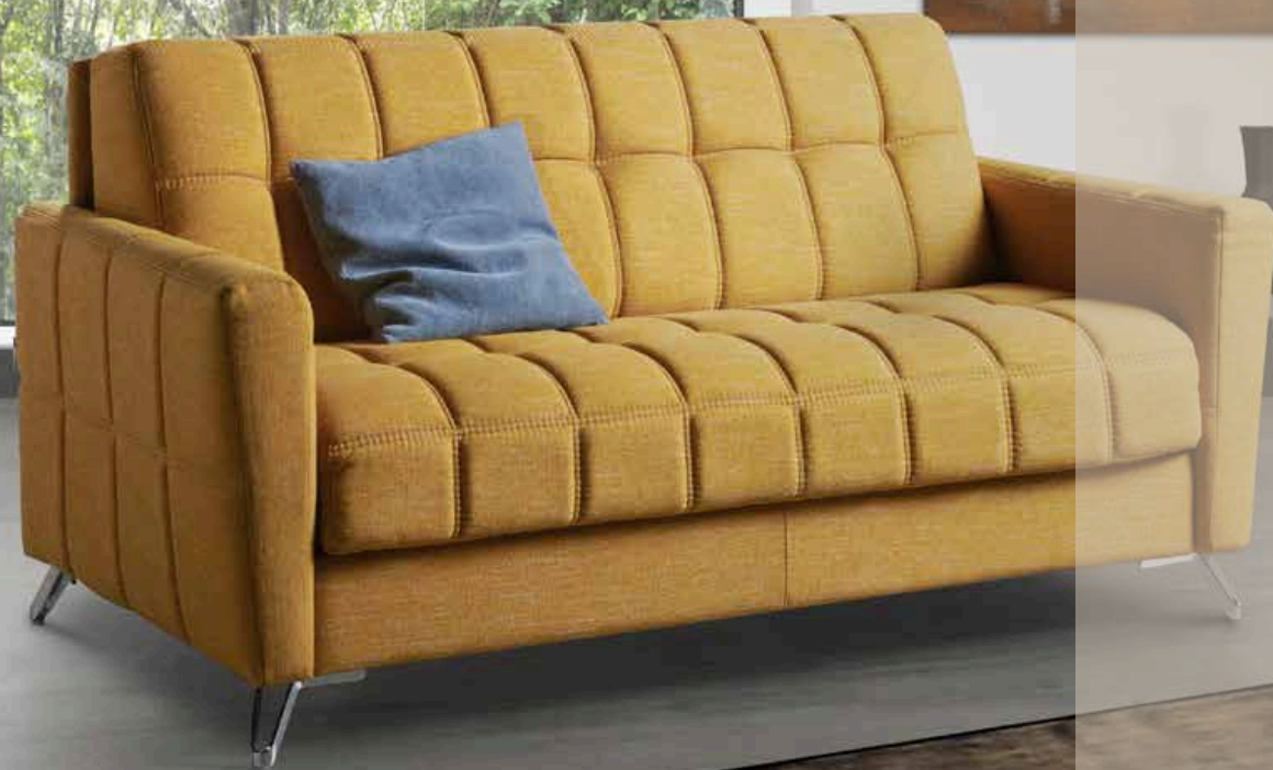
Tessuto Twist 10 Tissu Twist 10 Fabric Twist 10

Il divano Mixer ha sia il cuscino di seduta che lo schienale trapuntati con una doppia cucitura. Questo dettaglio rende i quadri separati e ben distinti, aumentando l'effetto morbido ed accentuando il gioco geometrico dell'imbottitura.